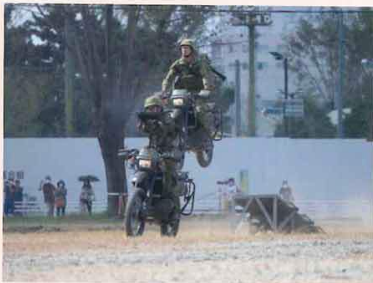
駐屯地創立記念行事 (訓練展示)