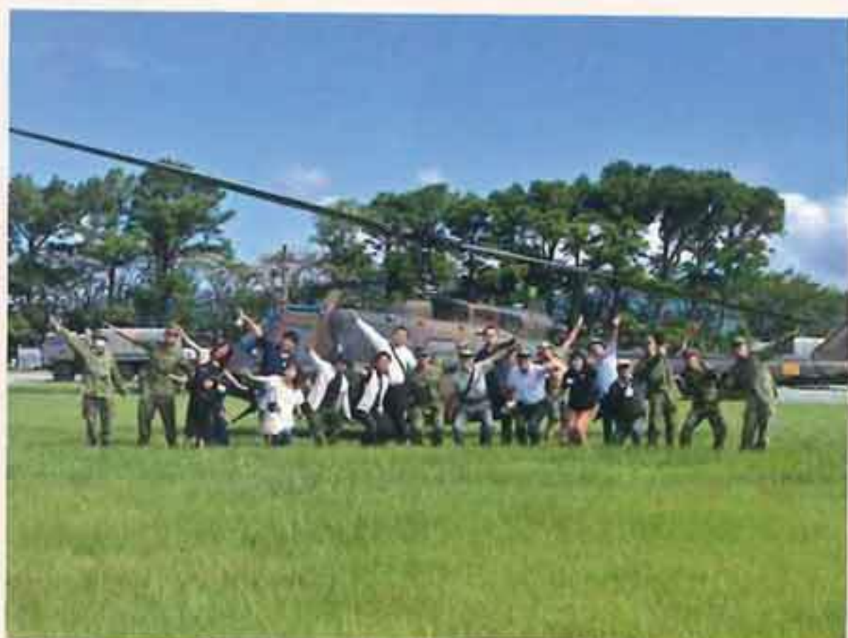
体験搭乗 (搭乗者全員で記念撮影)