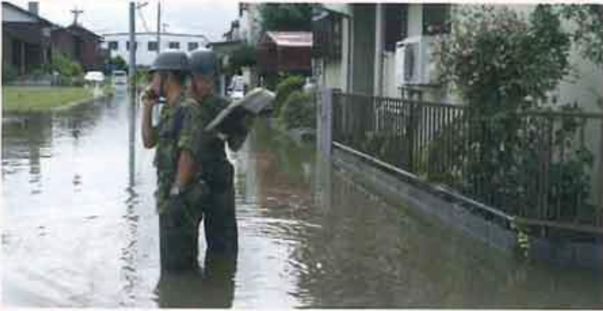
愛知県岡崎市における大雨災害（H20） （人命救助）