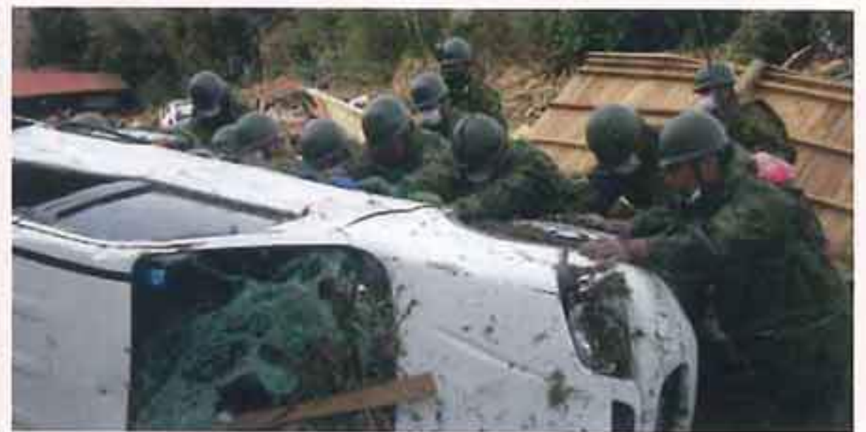
東日本大震災（H23） （人命救助）