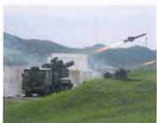
81式短距離地对空誘導弾(C)による射撃

敵の航空機などの攻撃から味方の部隊や施設を守ることを任務とする対空戦闘部隊です。