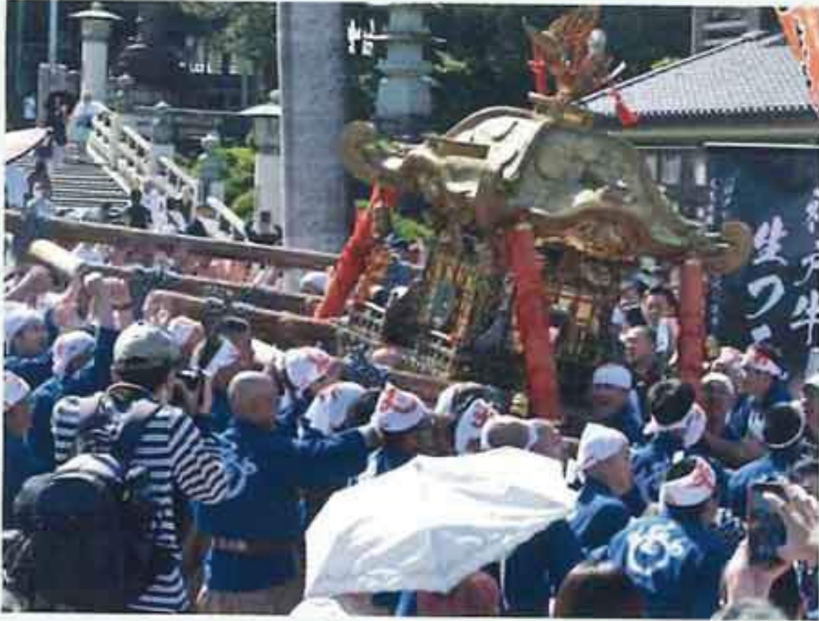
豊川稲荷春（秋）の大祭 （多くの隊員が参加）