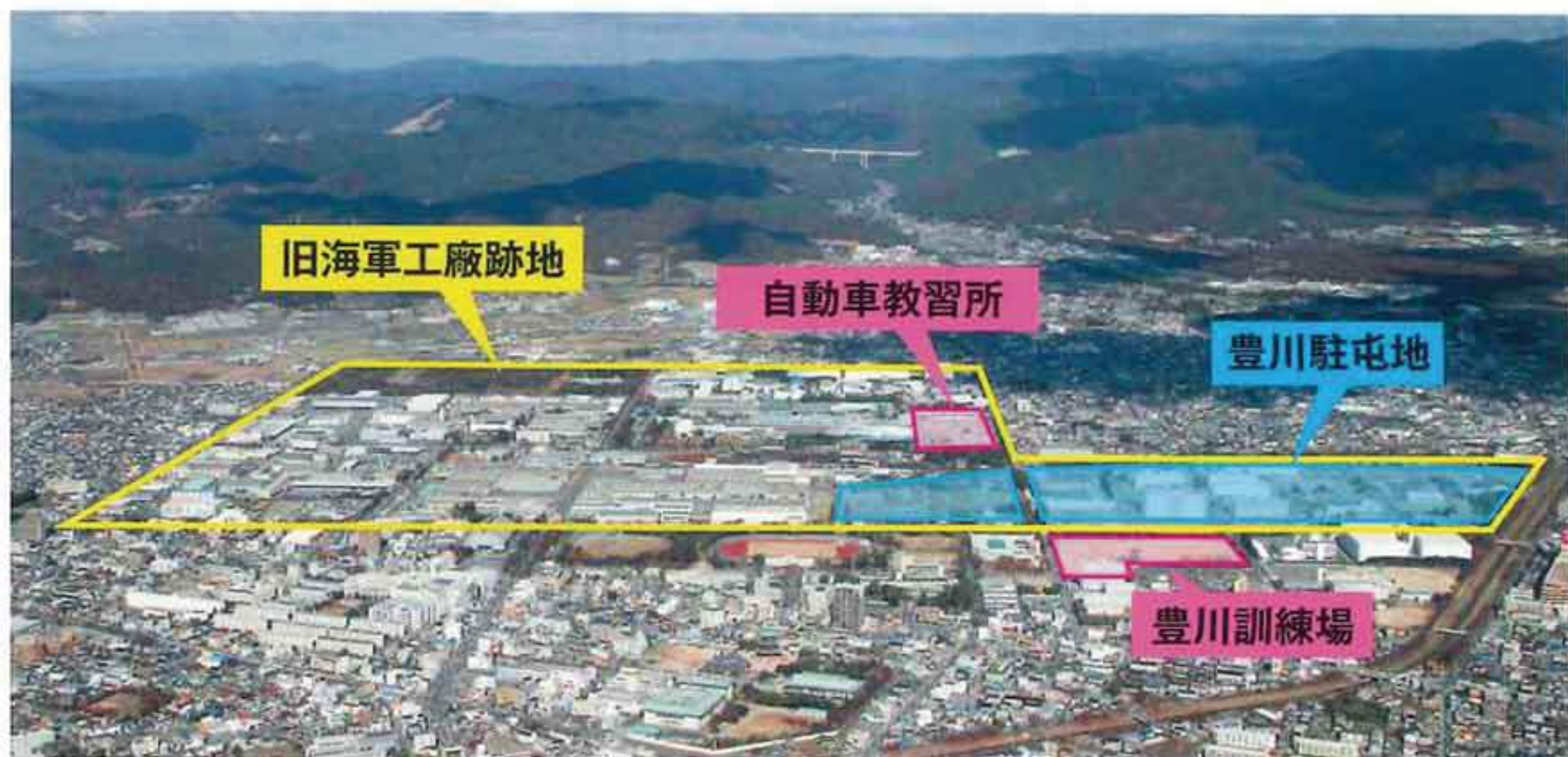
豊川駐屯地及び周辺地域

また、地震・風雪水害などに対する災害派遣や国際平和協力活動にも多くの隊員を派遣しています。