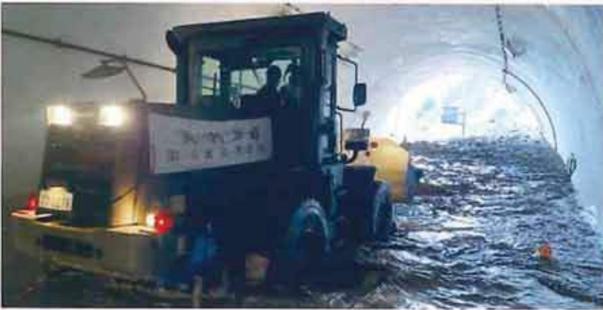
能登半島地震（R6） （道路整備）