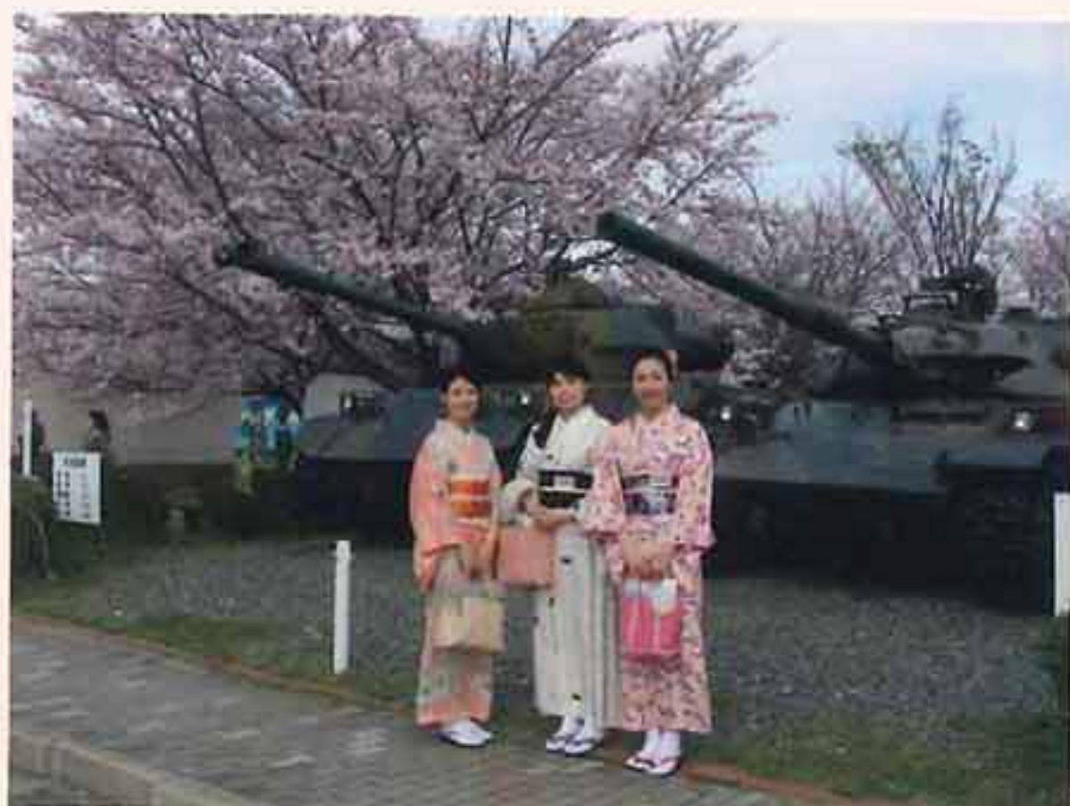
駐屯地春まつり (史料館等駐屯地一部開放)