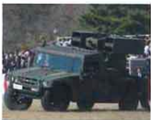
93式近距離地对空誘導弾