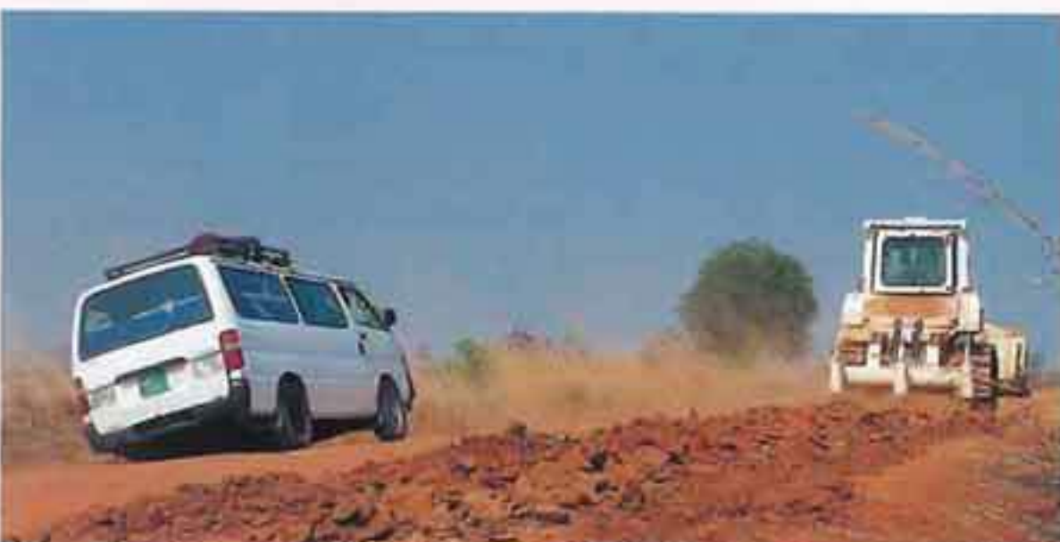
南スーダン国際平和協力業務（H28）