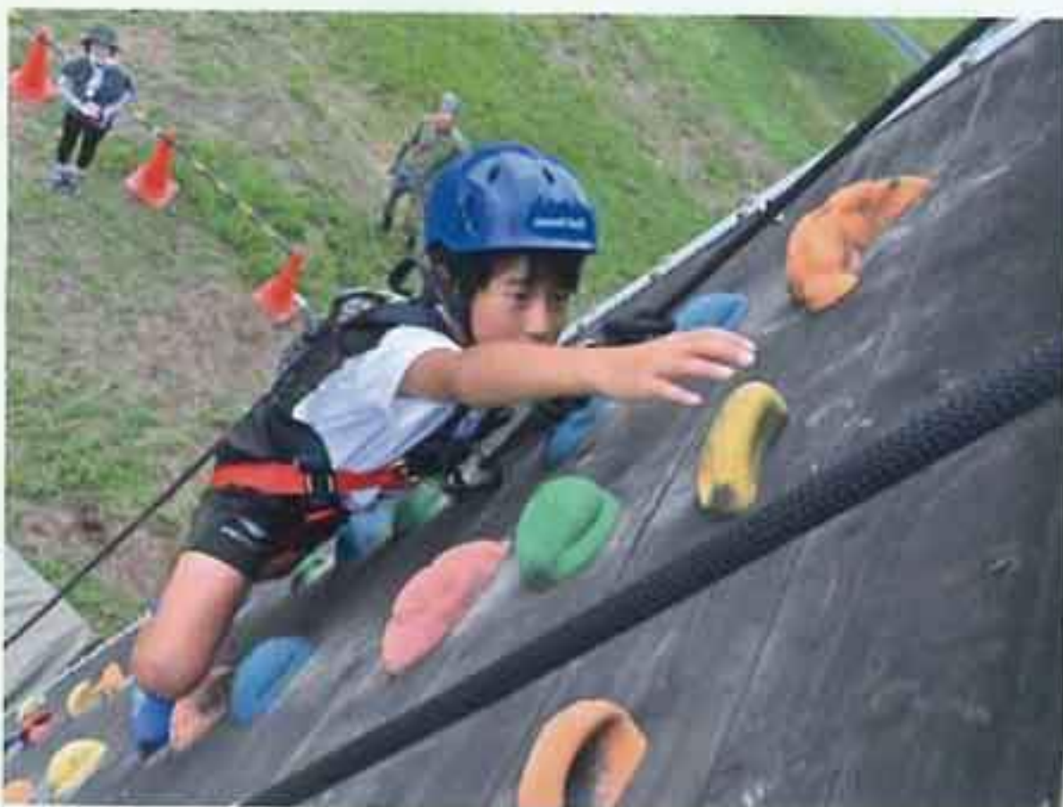
ちびっ子大会 （ボルダリング体験等）