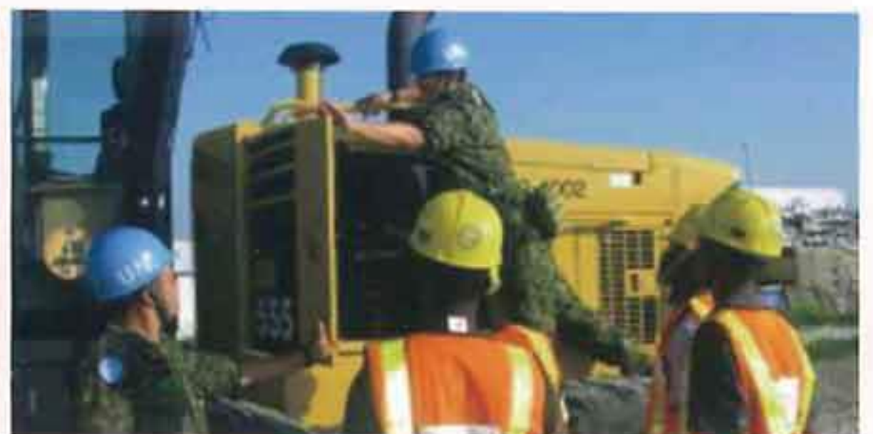
ハイチ国際平和協力業務（H24）