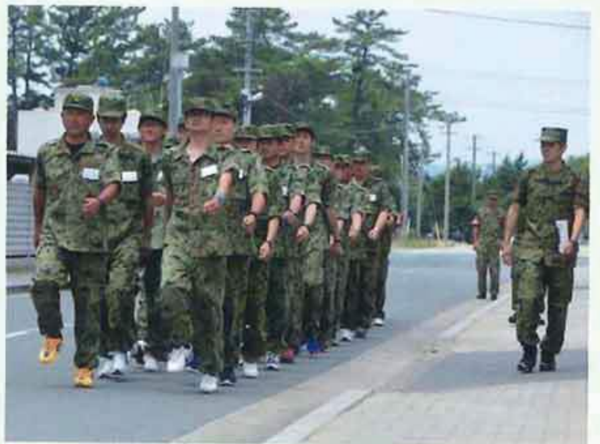
隊内生活体験 （自衛隊の生活を体験）