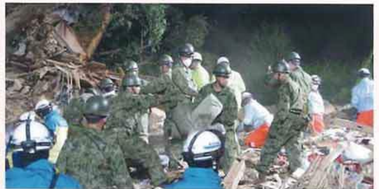
蒲郡市における台風10号による影響（R6） （不明者捜索）