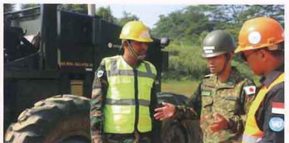
国連三角パートナーシッププログラム（R6）