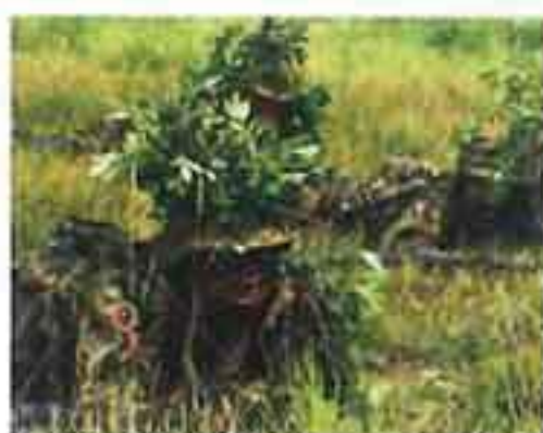
即応予備自衛官招集訓練