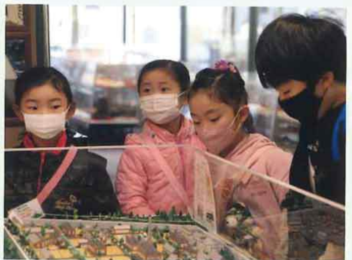
駐屯地見学 （三河史料館）