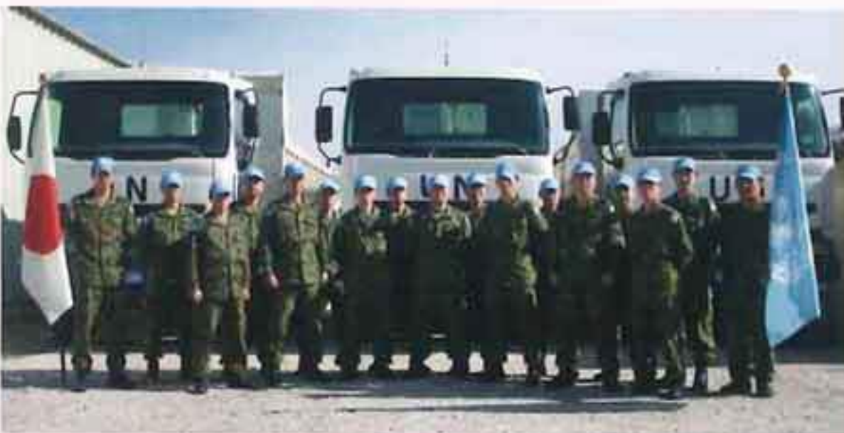
ゴラン高原国際平和協力業務（H23）