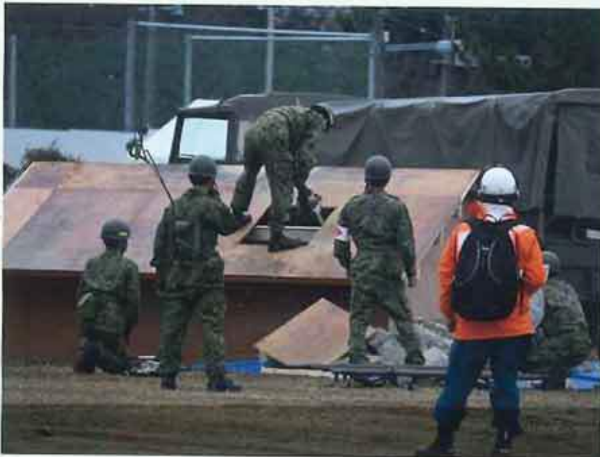
防災訓練 （倒壊家屋からの救出）