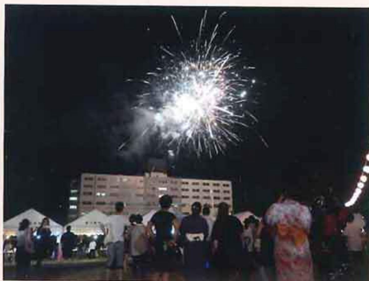
駐屯地納涼夏まつり (仕掛け花火)