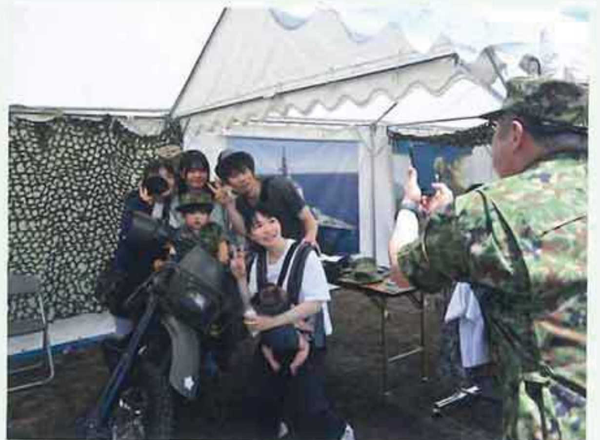
豊川市おいでん祭 （ミニ制服の試着と装備品展示）