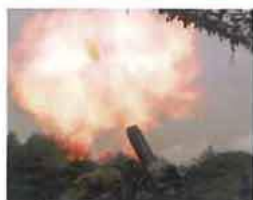
120ミリ重迫撃砲射撃

地上戦闘の骨幹部隊として近接戦闘能力を有し、有事の際には、即応予備自衛官と共に任務にあたる部隊です。