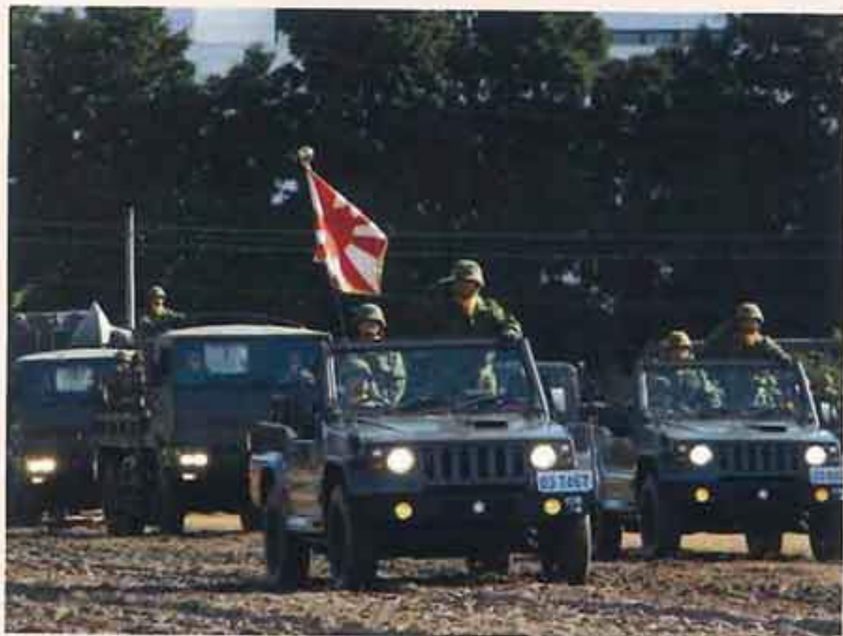
駐屯地創立記念行事 (観閲行進)