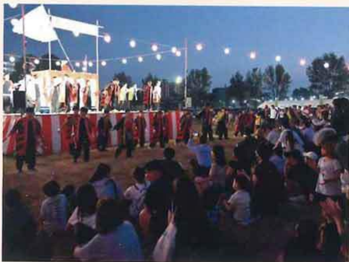
駐屯地納涼夏まつり (多くの市民も参加して楽しく行われています。)